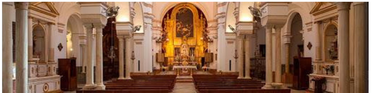
Interior de la Parroquia Santa María la Blanca.